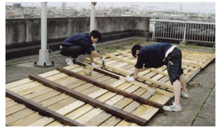
【スノコを加工しているようす】