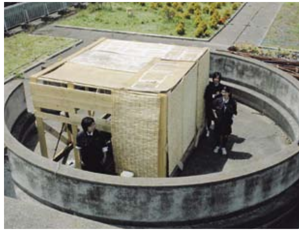
【生徒自作の野鳥観察小屋】