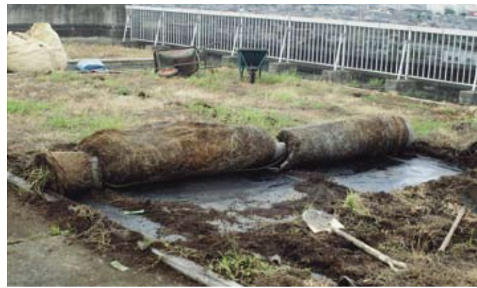
【土壌の張り替え工事のようす】

本年度、ヒバリと思われる卵が1つヒメイワダレソウの間に産み置かれていたが残念ながら2日後には見あたらなかった。また、アマガエルが7月に1匹確認された。屋上という隔離された環境だが、周囲から生物が進入してくる事がわかったので、今後は実のなる小灌木を中心に鳥や小動物が生息できる環境を作りたい。