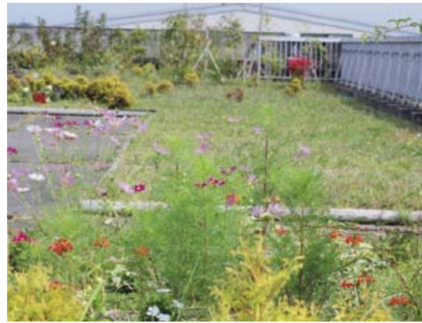
【屋上ビオトープに咲く花】