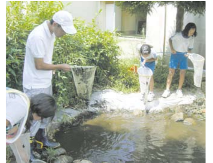
ため池拡張のためのメダカ救出