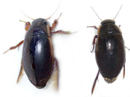
図1. シャープゲンゴロウモドキの成虫。左：オス、右：メス