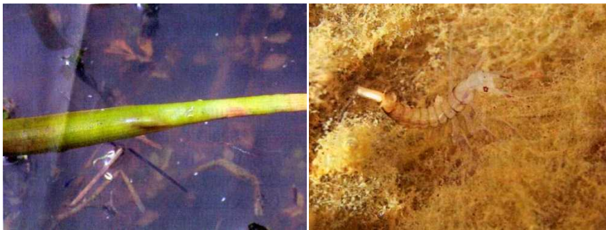
図3. セリの茎に産み付けられた卵（左）と孵化直後の1齢幼虫。