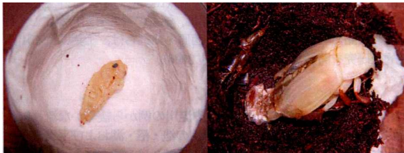
図5. 蛹（左）と羽化個体（右）。