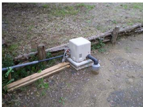
【新たに掘った井戸のポンプ】