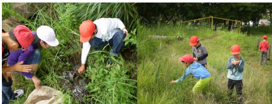
【児童による生きもの探しのようす】