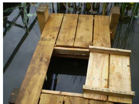
【新たな水中ポンプ】