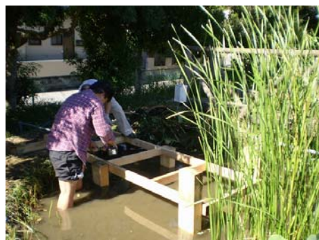
【水中ポンプの移設工事】