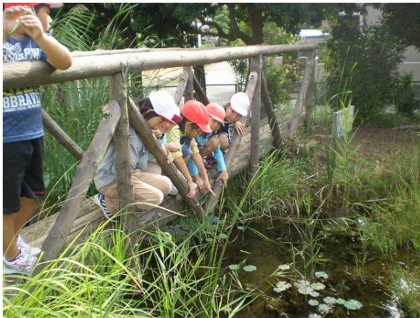
【休み時間は児童の憩いの場】